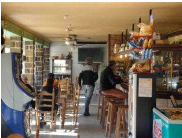
Un dels bars de Castellfollit, ahir.