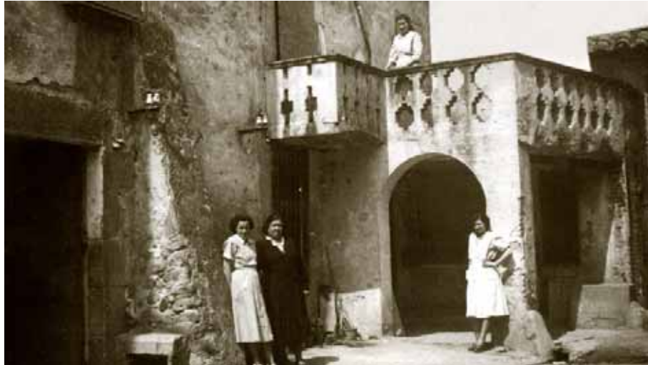
Pati de cal Sigarro, a mitjans dels anys cinquanta.

La casa , l'interior, l'eixida, els patis. Allà on vivia la gent, on guardava els seus secrets més secrets, on podien ser com eren de bo de bo..