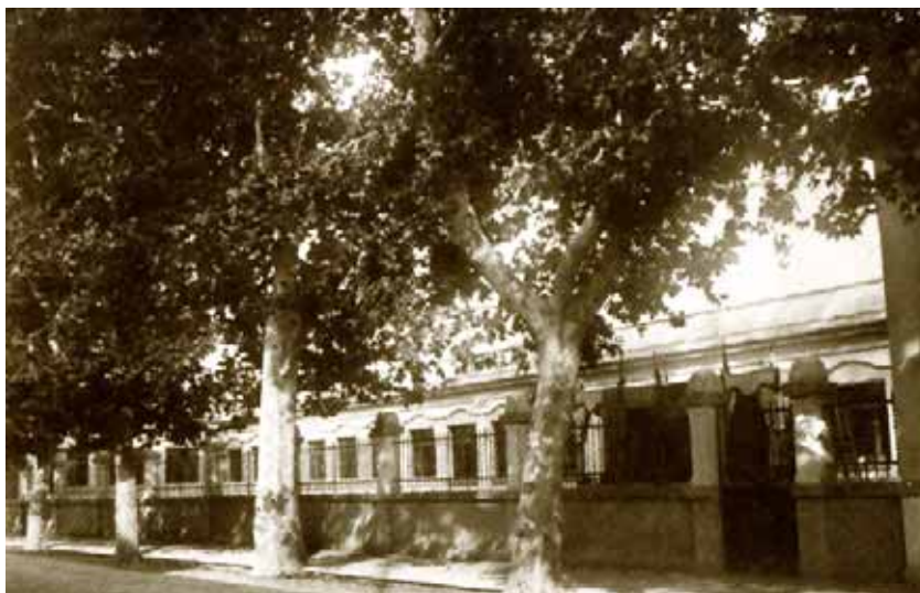
Les Escoles Nacionals, l'any 1929, just abans de la seva inauguració.

L'educació, les escoles, allà on s'aprèn a llegir i es descobreix que els llibres xerren.