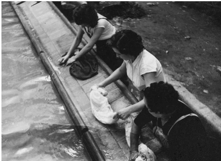
Dones rentant la roba al safareig públic, a principis dels anys cinquanta.

La vida quotidiana. Una vida molt diferent a la nostra, tanta que hi ha mil i una diferències amb tot allò que ara vivim.