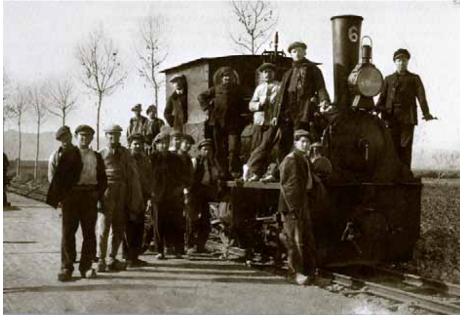
Imatge de la locomotora de vapor número 6 del tren d'Olot a l'estació de Girona, el mes de gener de 1915.

La mobilitat, els mitjans de transport , des de les bicicletes, al cotxe, al tren, la barca de llibant... varetes màgiques per arribar ben ràpid a tot arreu.