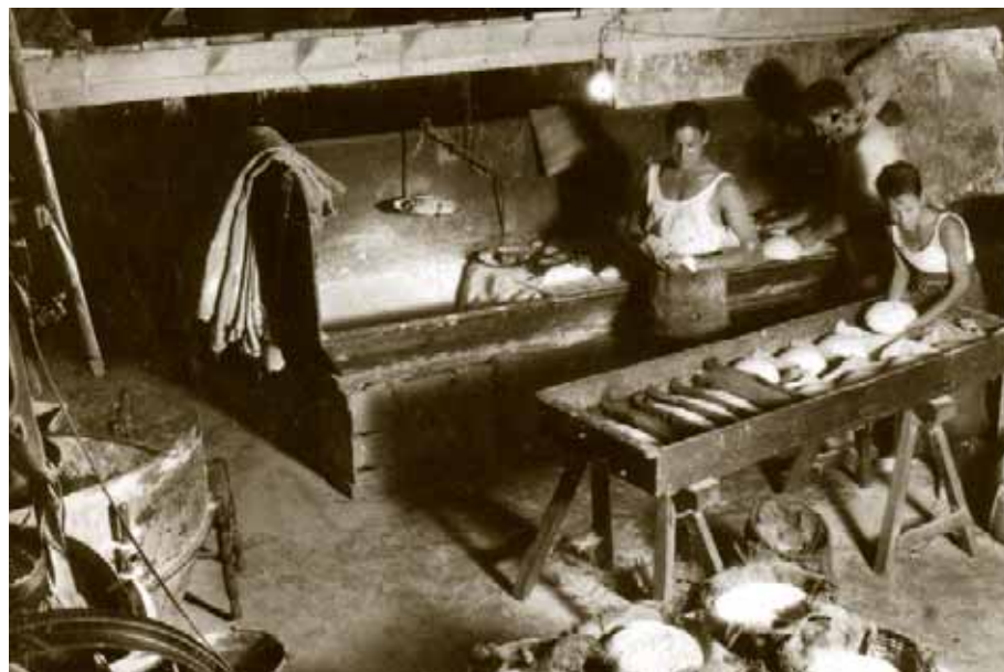
Imatge de la fleca de la fonda de can Berga del carrer Major, poc temps abans de l'any 1936.

Els oficis , amb els seus mestres i els seus aprenents. I ja se sap el que diu la dita: fent i desfent apren l'aprenent.