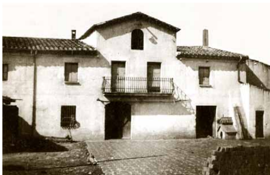
Façana de la masia de can Maret Nou.

La vida de pagès , una vida basada en la terra. Una terra fantàstica, perquè donava fruit i riquesa, i també perquè pot ser una font de sorpreses.