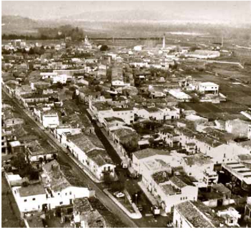
Panoràmica aèria del barri Vell.

Els carrers, el municipi , allò que era Salt fa tants anys. El mapa per trobar el que es busca.