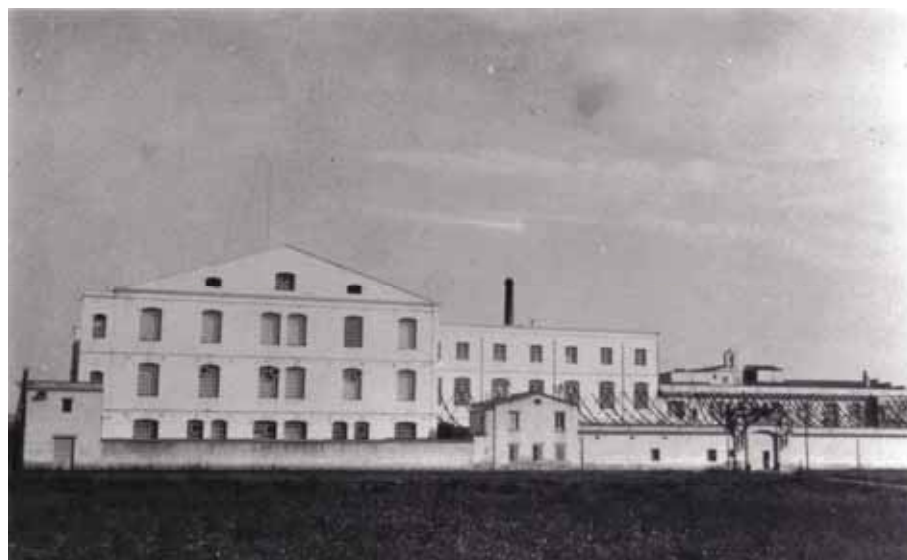
Coma Cros – Veinat de Salt