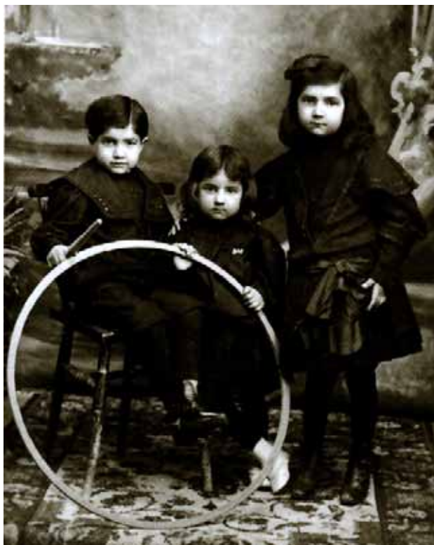
Infants amb a la típica rutlla, lany 1926.

L'oci , la manera de divertir-se, els jocs, els esports, les excursions... una porta bona de creuar.