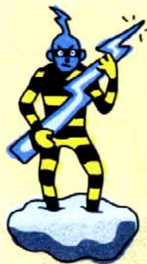
Fill del tro

Finalment, les bruixes feien estar sempre atenta i intranquil·la la gent d'aquestes contrades, car tenien els seus punts de reunió ben a prop seu: a la Gorga de les Bruixes de Sant Martí de Llémèna, per exemple qualsevol fet o paraula que les pogués ofendre podia ser doblement negatiu.