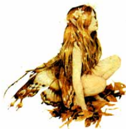
La dona és gairebé sempre la protagonista principal de les llegendes vinculades amb l'aigua.

D'altra banda, en totes les llegendes que evocen la presència de les goges, les aloges o les dones d'aigua el component femení és del tot dominant, i en canvi, el component masculí sempre va a remolc de les condicions que s'expliciten des de l'altre costat.