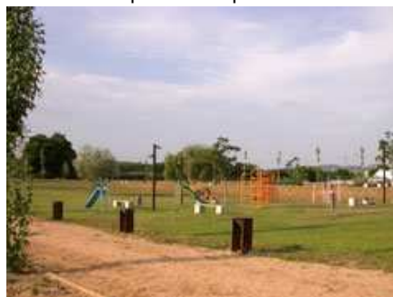
zona de jocs infantils (petits)