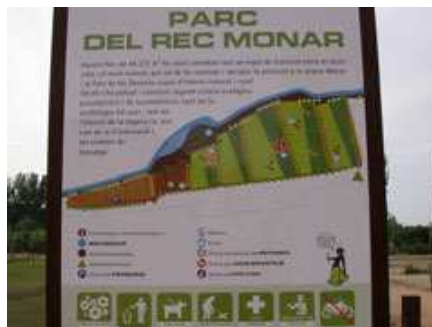
plànol del parc

El recorregut actual de la sèquia, des de la Pilastra, on recull les aigües del riu Ter, fins al seu desguàs al riu Onyar a tocar del pont de Pedra de Girona, és relativament modern, tot i que tenim dades d'aquest rec des de principis del segle XI, en temps del comte Borrell. N'hem de destacar el seu paper clau en el desenvolupament de l'agricultura d'horta, en el proveïment d'energia a l'època medieval per a molins i fargues i, al segle XIX, el seu paper determinant per a la instal·lació de les fàbriques tèxtils a la Vila.