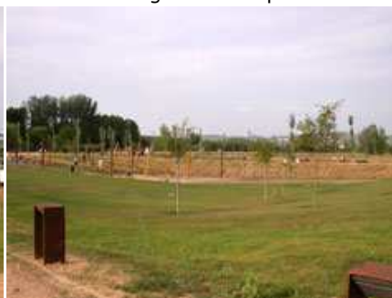
zona de jocs infantils (grans)