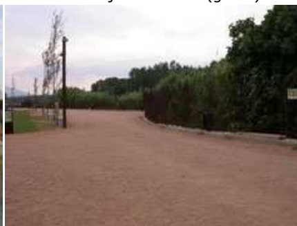
zona de passeig