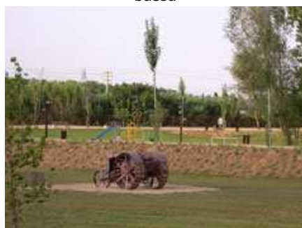
un tractor al parc