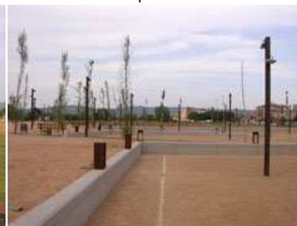
pistes de petanca