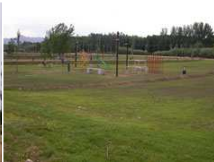
vista general del parc