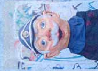
EL SR. ENRIC