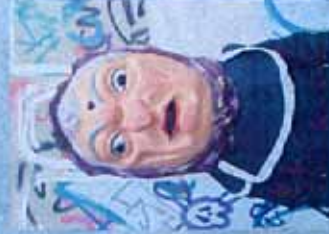
LA IAIA LOLA