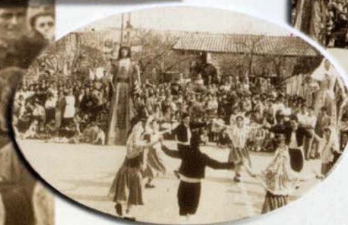
FOTOGRAFIES DEL DIA DE LA FESTA.

PROGRAMA I TEXT EXTRET DEL FULLETÓ EDITAT PER ANUNCIAR EL BATEIG DELS GEGANTS, EL DIA 19 D'OCTUBRE DE 1952.