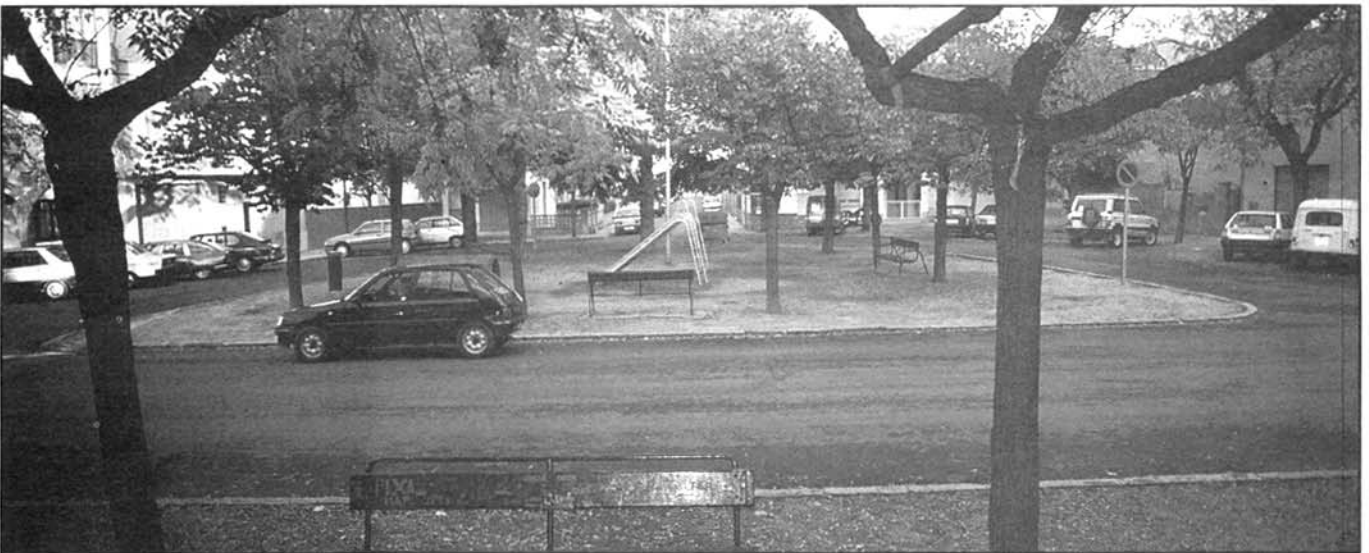
Plaça de Pau Casals