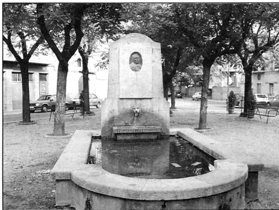
Plaça de Mossèn Jacint Verdaguer. Havia estat un cementiri de cavalls. Durant l'època d'annexió a Girona s'anomenava plaça de Salt.