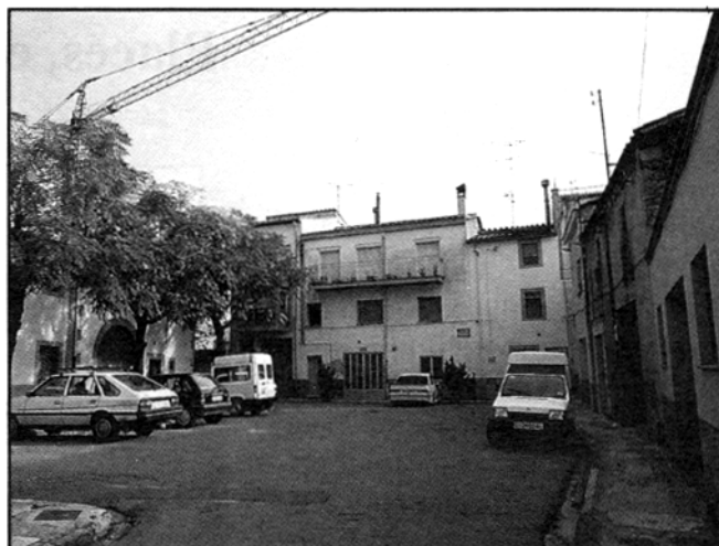
Placeta de Juli Garreta.

Els espais públics localitzen i articulen el teixit urbà, les places en quant a espai públic tenen aquesta funció i formen part del desenvolupament urbà formalment planificat, del disseny urbà; els materials, textures, geometries, formes, són mecanismes per delimitar un espai i un entorn, no hi ha metodologia, es requereix una intervenció puntual, no hi ha més regles que les pròpies del fenomen que representa cada lloc.