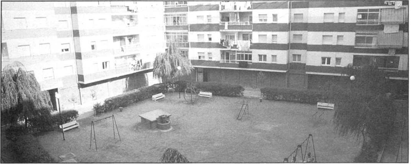
Plaça de la Convivència.