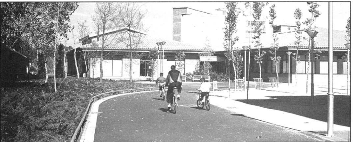
Carrer de la Diputació. Una zona recuperada de Salt.