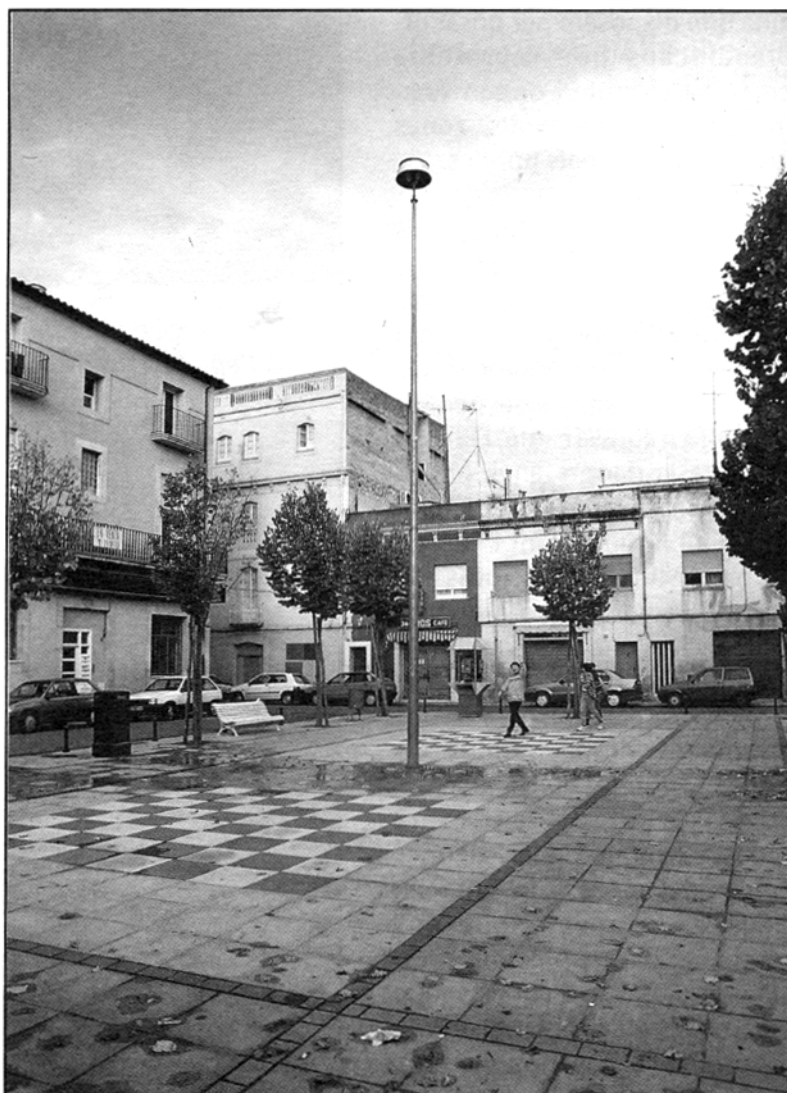
Plaça del Veïnat. Aquest nom és a partir de l'annexió a Girona, abans se'n deia plaça de Sant Pere.

Però la sensació de tancament no és l'únic efecte desitjable, les regles de la perspectiva i l'efecte espacial ha d'ésser l'adient i dependrà de la ubicació de l'espectador i evidentment de la col·locació dels límits, per obtenir un resultat òptim; si recordem les places, antigament, la delimitació dels espais públics venien