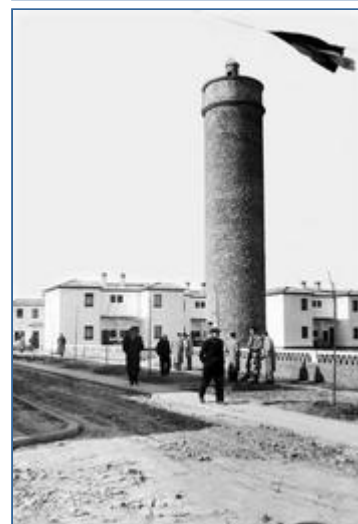
+ El dipòsit de l'aigua i cases. A dalt, el lliurament de les claus. A sota, la construcció.