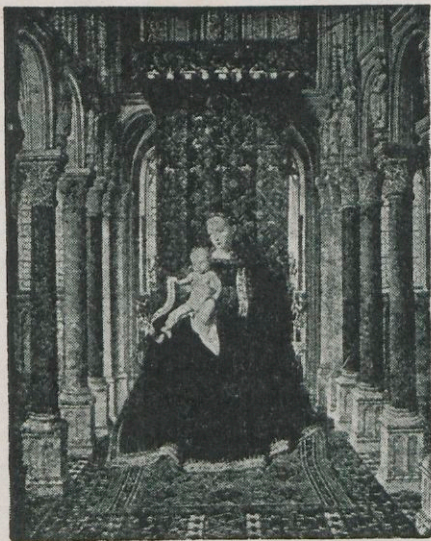
Sedes sapientiae Ora pro nobis