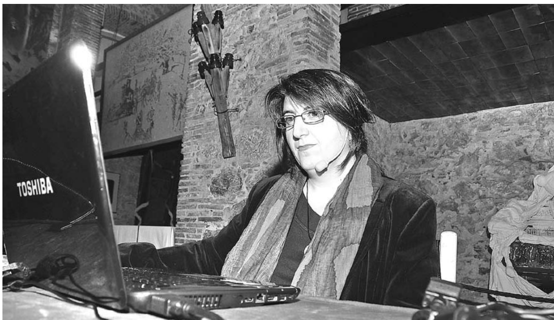
VALLÈS I SEGURANYES. Una foto de l'artista al seu estudi i la conferència de dijous al Museu Dalí